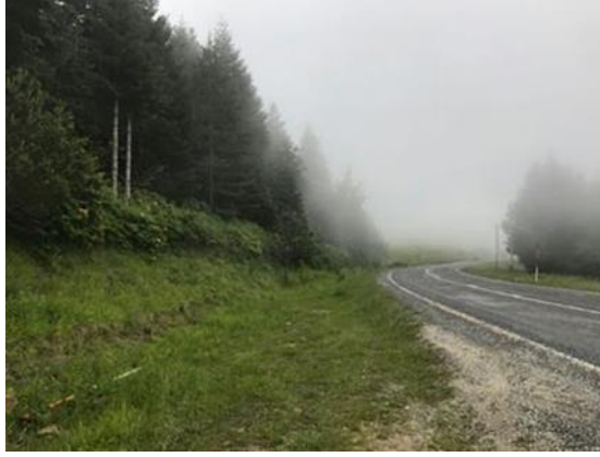
Resim 5. Dürtmen Yaylası

(Kaynak: http://alacamposta.com/haber_detay.asp?haberID=3402&alacam-durtmen-yaylasi-dogal-guzellik-ve-biyocesit.html Erişim: 25.11.2020).