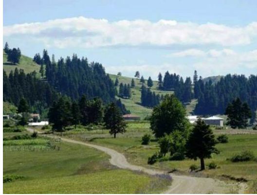
Resim 4. Uzunkız Yaylası

Samsun'un Yakakent ilçesindeki Uzunkız Yaylası ilçe merkezine 35 kilometre uzaklıkta bulunmaktadır. Samsun'un diğer yaylalarına göre ulaşım biraz zordur. Çam ormanları arasında bulunan 1300 rakımlı Uzunkız Yaylası, tertemiz havası ile son dönem de turistlerin ilgisini çekmeye başlamıştır (samsun.ktb.gov.tr).