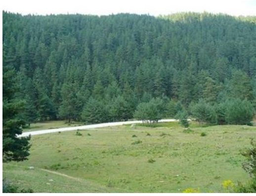
Resim 2. Kunduz Yaylası

Kunduz Yaylasında yayla şenlikleri düzenlenmektedir. Sonbaharda ve kış aylarında ormanın oluşturduğu kartpostallık görüntüleri çekmek isteyen pek çok fotoğrafçı da bölgeye gelmektedir. Kunduz Yaylasında off-road yarışları da yapılmaktadır. Yine 30 hektarlık alan içerisinde içinden Soğuksu Deresinin geçtiği kamp alanında çadır kurulabilmektedir. Kunduz yaylası dağ bisikleti yarışları için çok uygun koşullara sahiptir. Ayrıca Kunduz Yaylasının Altinkaya Barajına ve Şahin Kaya Kanyonuna yakın olması yayla da turizmin gelişmesi için bir avantajdır. Bölge bütüncül olarak değerlendirildiğinde turizmden daha fazla pay alacaktır. Ancak yayla ve çevresinde konaklama tesisinin olmaması bir dezavantajdır. Bölge ile uyumlu çevre dostu konaklama tesisi, doğa ile baş başa kalmak isteyenler, sporcular ve doğal hayat gözlemcileri gibi alternatif turizm severler tarafından tercih edilebilir.