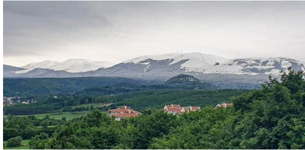
Resim 1. Akdağ

2062 metre rakımlı Akdağ Dağının çevresinde çok geniş yaylalar mevcuttur. Bunlar arasında Ladik Yaylası, Hasırcı Yaylası, Gürcü Yaylası, Büyükkızıoğlu Yaylası, Küpecik Yaylası, Çakırgümüş Yaylası ve Aktaş Yaylaları sayılabilir. Akdağ üzerinde bulunan yaylalardan en büyüğü ve en meşhuru Ladik Yaylasıdır. 1500 rakıma sahip olan yaylanın Ladik ilçe merkezine uzaklığı 7 km, Samsun şehir merkezine olan uzaklığı ise 84 km'dir. Yolu asfalt olup, ulaşım sıkıntısı yaşanmamaktadır. Ladik Yaylasında her yıl yayla şenlikleri düzenlenmektedir. Ladik yaylasında yayla evleri mevcuttur ancak turizm amaçlı hizmet veren bir işletme yoktur. Akdağ Kayak Merkezindeki işletmeler de yaz döneminde hizmet vermemektedir. Yaz döneminde yürüyüş yapmak ve dağ havası almak için yaylaya gitmek isteyen ziyaretçiler için tesislerin olmaması yöre turizminin gelişimi önünde bir engeldir. Yayla çim kayağı için elverişli şartlara sahip olduğu için, bölgede çim kayağı etkinlikleri de yapılmaktadır. Ayrıca bölge trekking ve yamaç paraşütü gibi etkinlikler için de uygundur. Akdağ Yayları, Lâdik'te bulunan kaplıcalar ve Ladik Gölüyle beraber bir turizm destinasyon alanı haline getirebilir.