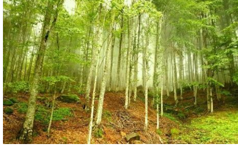
Resim 3. Nebiyan Ormanları